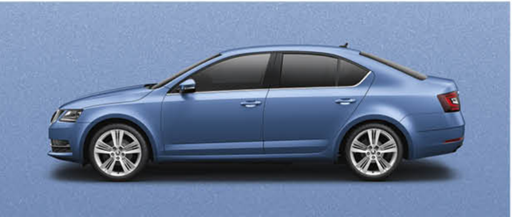
BLEU DENIM METALLISE