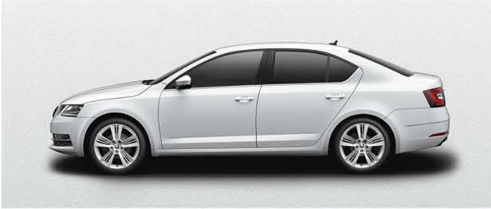
BLANC LUNE METALLISE