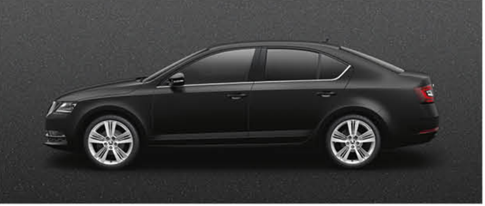
NOIR MAGIC NACRE