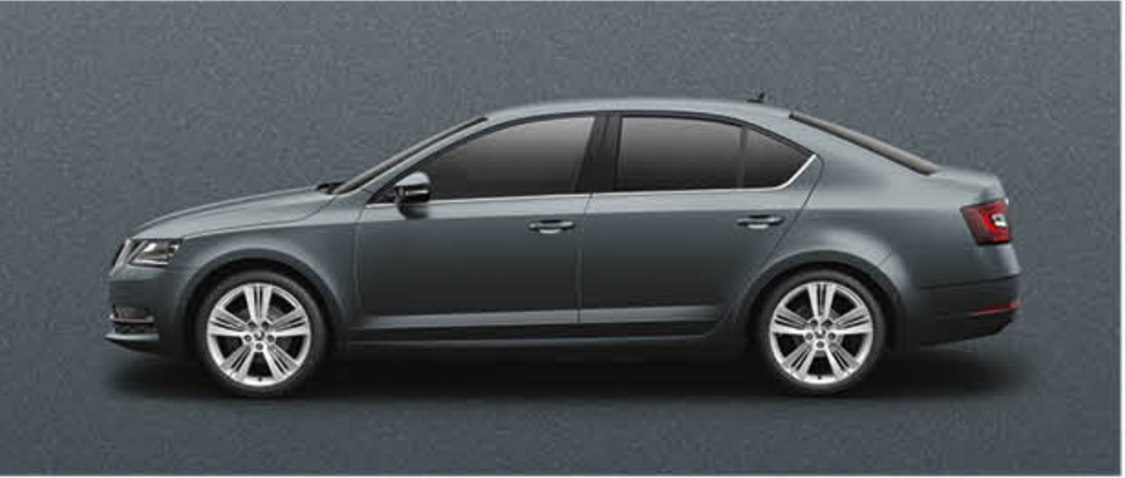
GRIS METEORE METALLISE