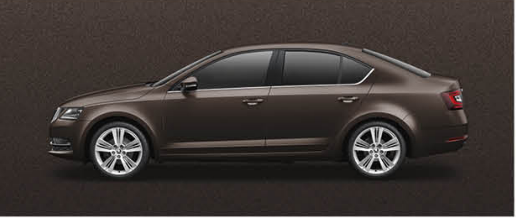
BRUN ERABLE METALLISE*