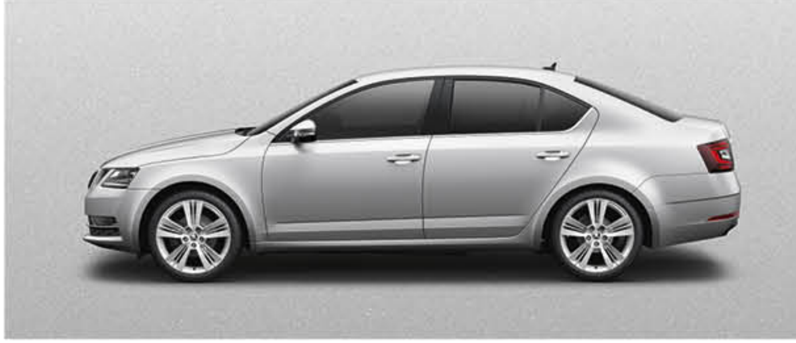
GRIS ARGENT METALLISE