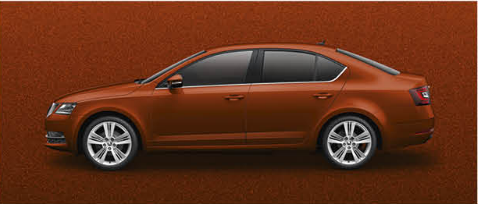
ROUGE RIO METALLISE