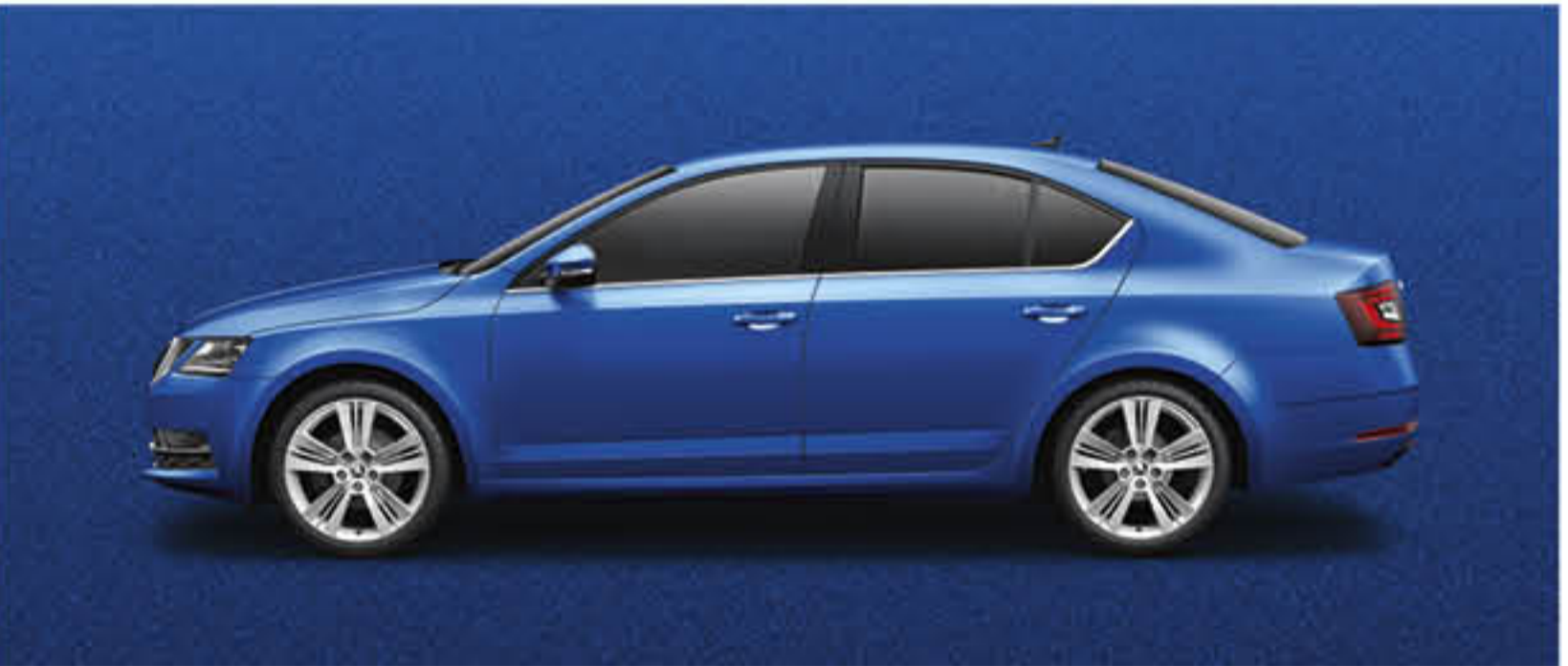
BLEU RACING METALLISE