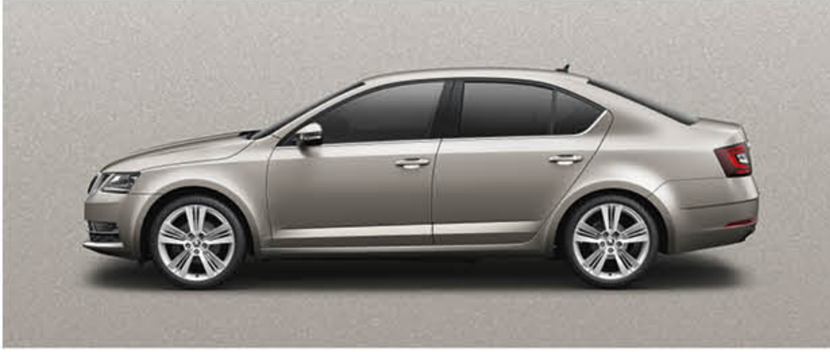
BEIGE CAPPUCCINO METALLISE