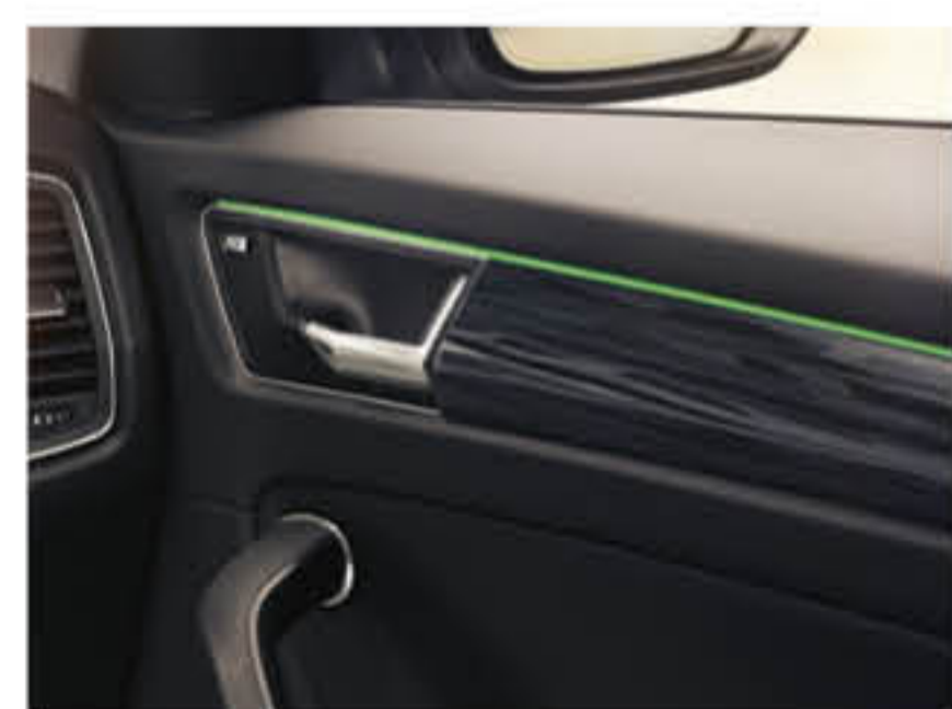
Éclairage d'ambiance vert