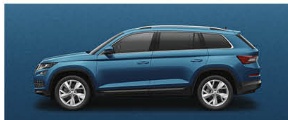
BLEU LAVE METALLISE