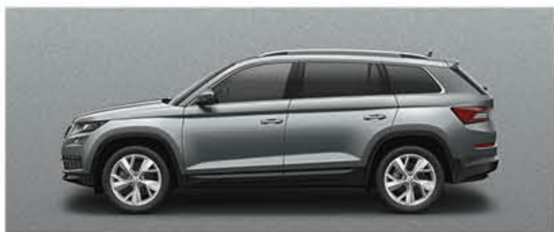
GRIS BUSINESS METALLISE