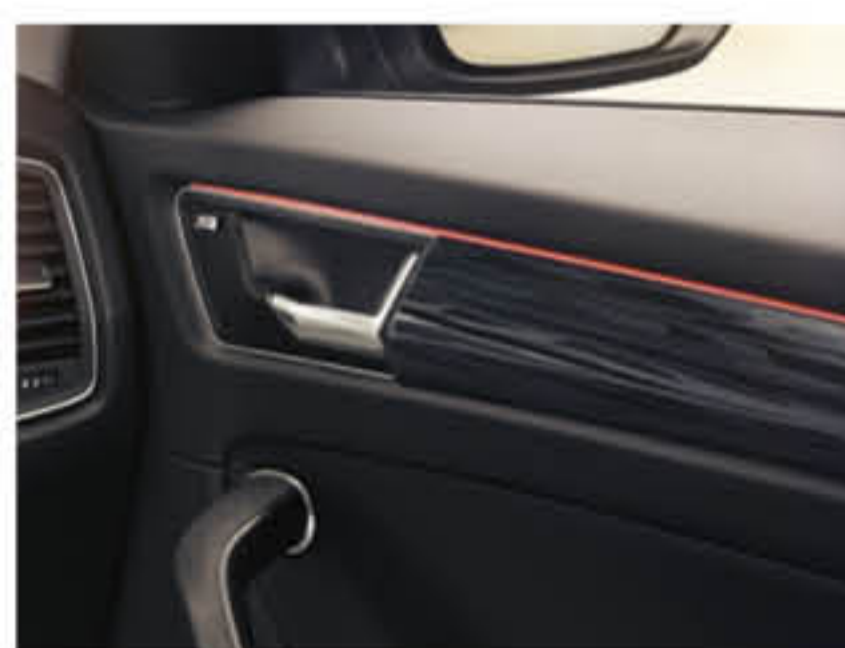
Éclairage d'ambiance rouge