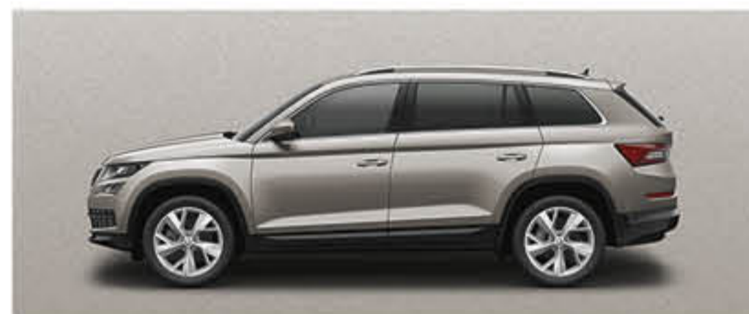
BEIGE CAPPUCCINO METALLISE