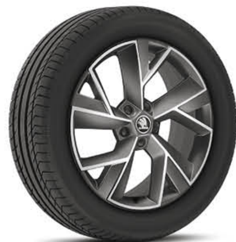
Jantes alliage 17" RATIKON