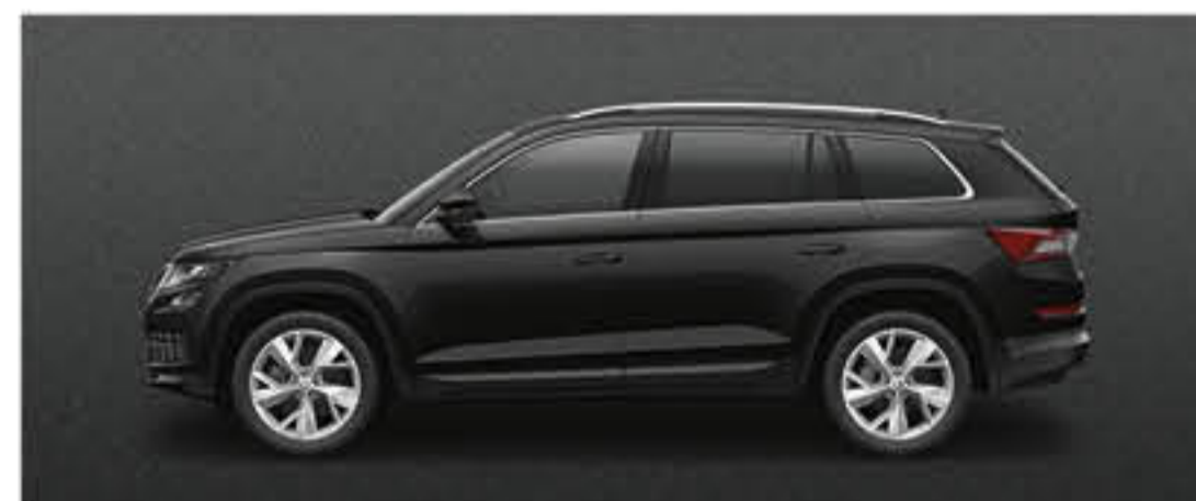
NOIR MAGIC NACRE