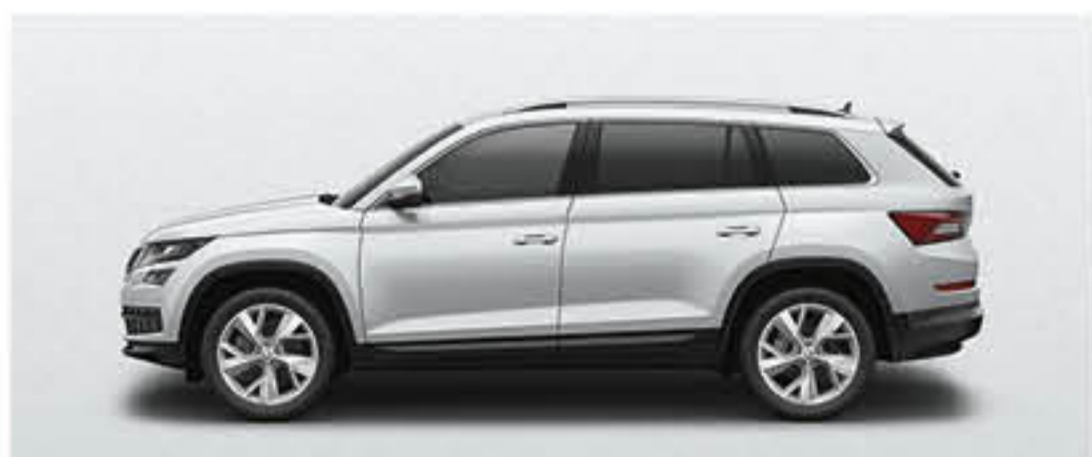
BLANC LUNE METALLISE