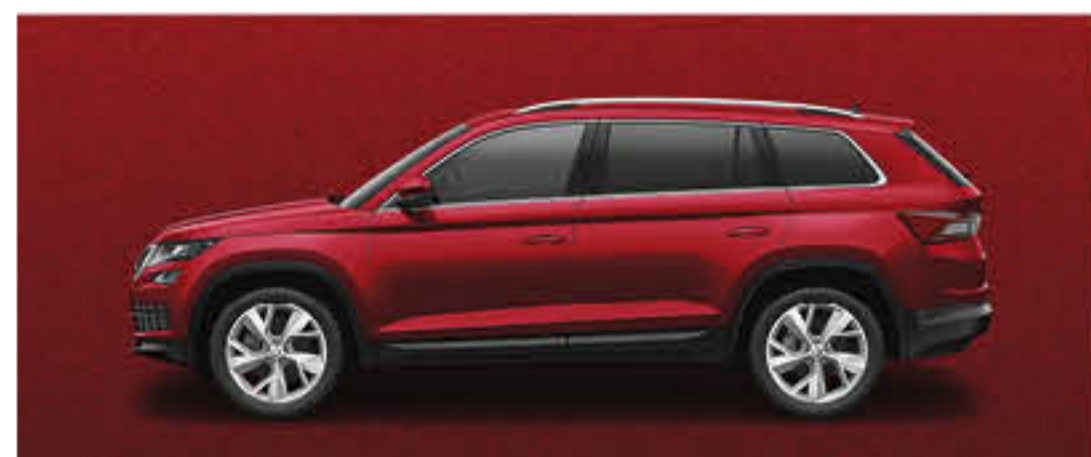
ROUGE VELVET PREMIUM