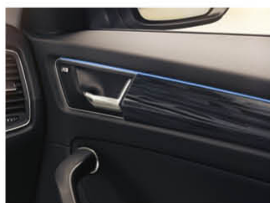
Éclairage d'ambiance bleu