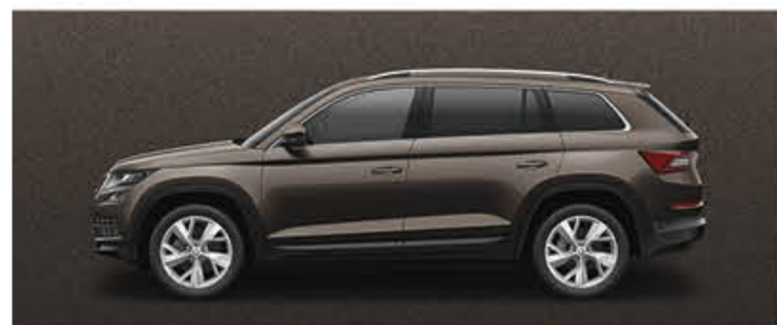
BRUN MAGNETIQUE METALLISE