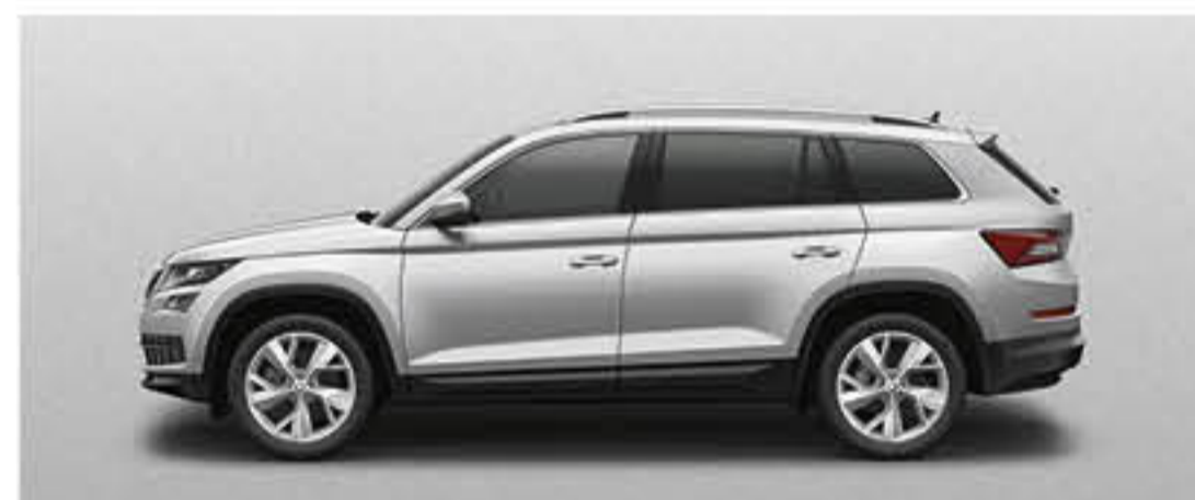
GRIS ARGENT MATALLISE