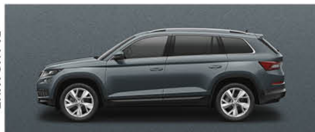
GRIS METEORE METALLISE